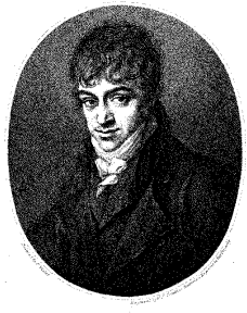
Associazione Giuseppe Acerbi Castel Goffredo

PREMIO LETTERARIO Giuseppe Acerbi CASTEL GOFFREDO